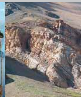
Pli couché au Ladakh