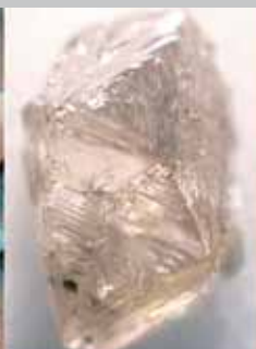
Minéral de haute pression dans un diamant